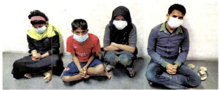
PIHAK berkuasa memberkas empat warga Rohingya yang cuba masuk ke Malaysia melalui Pantai Morib pada 30 Disember tahun lalu.

mengesan cubaan pihak tertentu membawa masuk 150 PATI ke Malaysia setiap minggu untuk bekerja di pelbagai lapangan selepas mendapati sektor ekonomi