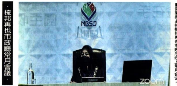
梳邦再也市政廳常月會議