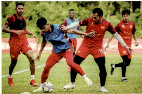
PEMAIN Selangor menjalani latihan akhir menjelang pertemuan menentang Kuching City di tadium Majlis Bandaraya Petaling Jaya, Sabtu.

dah lengkap vaksinasi, tidak bergejala dan berumur 18 tahun