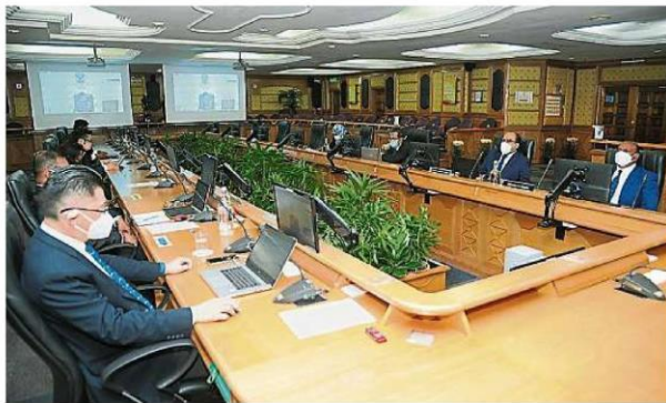
梳邦再也市政厅星期三（27日）上午以混合式进行常月会议，部分市议员出席实体会议，部分则通过线上参与。

（八打灵再也27日讯）截至10月23日，梳邦再也市政厅管辖区内累计7万2797宗新冠病毒确诊病例，以及445宗死亡病例。