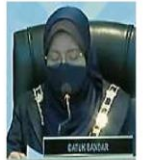
诺莱妮指出，梳邦再也市政厅目前共有1500名工作人员已经完成接种两剂新冠疫苗。

梳邦再也市政厅在常月会议结束之后，也宣布2021年新世代爱国歌曲比赛中学与小学组的得奖者名单。